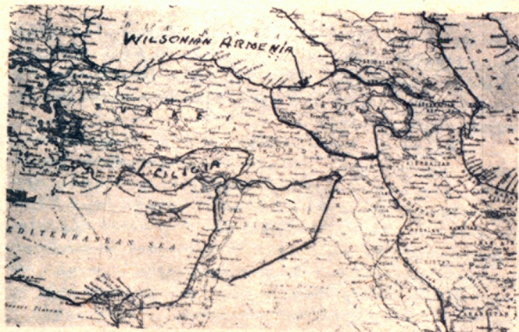
Ռիլսընեան Հայաստանի սահմանները

Համոզած էին նաեւ, թէ Արեւելեան Նահանգներու մէջ պատրաստուելիք այս ուժով՝ կարելի է տակաւին նորակազմ եւ հայերու Դաշնակցութիւն կուսակցութեան վարչութեան տակ գտնուած Երեւանի կառավարութեան բանակները ցրուել: