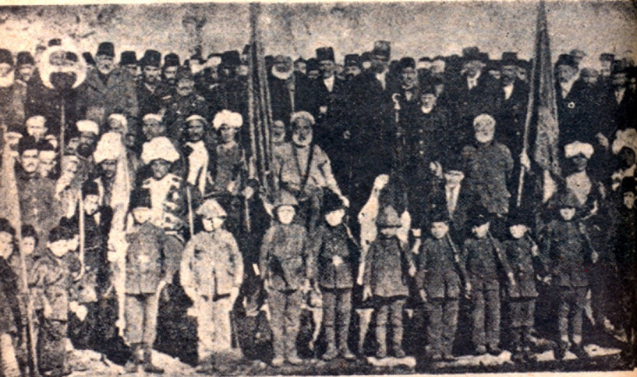
«Սրբազան պատերազմի» (ձիհատ) հանդիսաւոր հռչակումը

Ազատականներու յայտնի դէմքերէն Սոճա Մուսթաֆա Սապրի՝ Շէյխ-Իւլ-Իսլամութեան, ձէմալ՝ ներքին, Իսմայիլ Սատք՝ Արդարութեան, Վասֆի՝ Կալուածոց, Ալի Քէմալ՝ Կրթական, Էաշէմ՝ Երկրագործական, Մուհամմէա Ալի՝ Փոսթ եւ Հեռագրական նախարարութիւններուն մաս կազմելու հրաւիրուած էին: