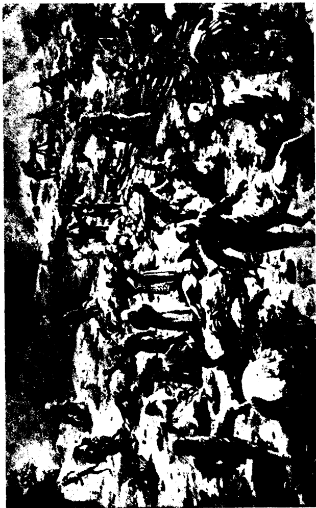
Հայ երիտեմն տեսարաններ կարգավորող

եկած եւ հանրային կարծիքը պղտորող եւ իթթիհատ եւ թէրագգըն ամրապնդելու կարծէք անուղղակի ուժ կու տային: