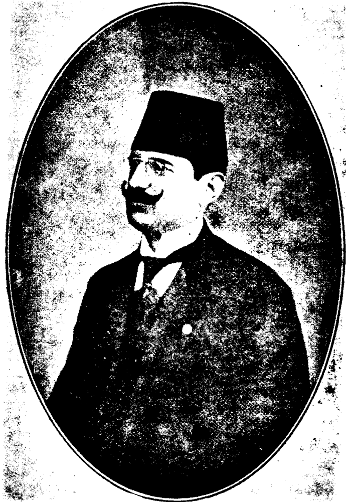
ՄՈՒՍԹԱՅԱ ԱՊՏԻԼԼԱԼԻԲ ՊԵՅ Հալէպի կառավարիչ

Կառավարութիւնը սնանկ վիճակի մէջ էր, որովհետեւ հանրային հարստութիւնները՝ պատերազմի ընթացքին խլուած՝ Միջագետք կամ Սուրիա արտածուած էր: Պոլսոյ եւ Անատոլուի մէջ ոսկի, արծաթ դրամներու հետքը