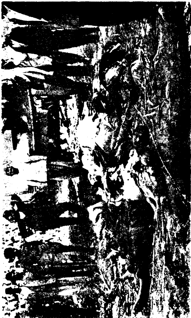
Հայ եղբուհի մե տեսարաններ

Ժամանակ ալ եզրպտոս գտնուելով ի վնաս իր հայրենիքին պաշտօններ ստանալու ստորնութիւնն ալ գործած էր: