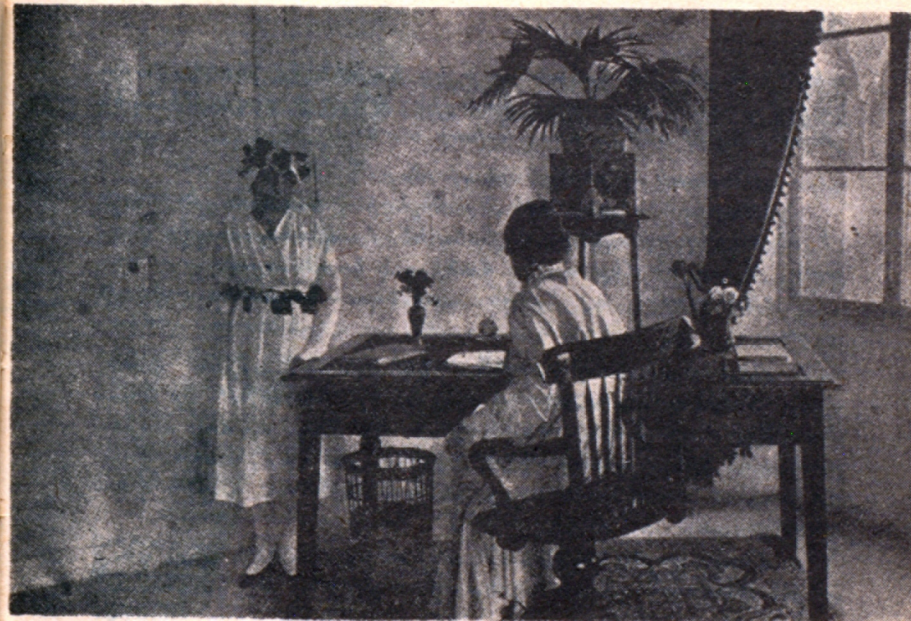
Հայ որբերը Երբացնելու միտող տխրահոշակ Հալիտէ Էտիպէ Հանրմ. դէմը կեցողը՝ հայ որբուհի մըն է

«Երբեմն այրի կիներ անառակ զաւակներ կ'ունենան, որոնք սնտուկները կը բանան, դրամ կը գողնան, հազուս-