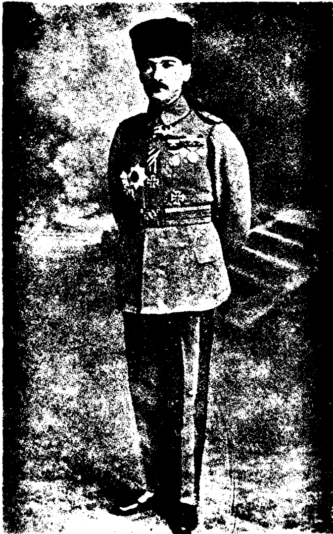
ՄՈՒՍԹԱՖԱ ՔԷՄԱԼ ՓԱՇԱ

«ԵՐԼՈՐՐԵՄ» բանակին հրամանատարը եւ ազգայնական շարժումին պետը