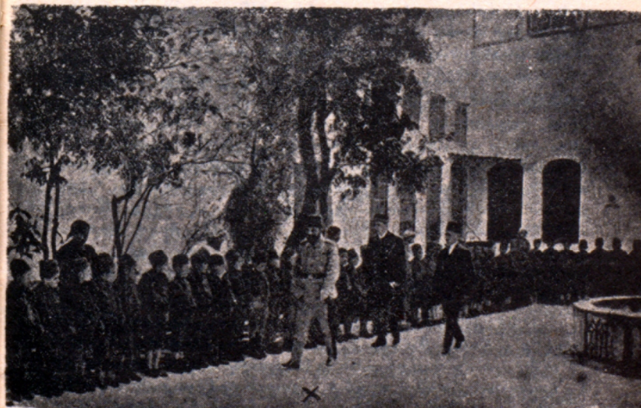
Ճեմալ փաշա Գամաակոսի մէջ հայ որբերը կը գննէ: Իր առաջին տեղակալը՝ Նուսրէթ պէյ եւ Գամաակոսի տեղահամեալ հայերու միտիրը՝ Չէրէֆ Հասան պէյ՝ որ Նուսրէթի կը հետեւի: