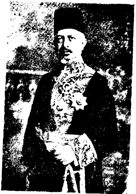
ՍԱՒՏ ՀԱԿԻՄ ՓԱՇԱ

Բ. Դուռը վէրսայլ հրաւիրուած ըլլալուն, Ֆէրիտ փաշա մէկ կողմէն հաշտութեան համար իր պայմանները դասաւորելու եւ տեղեկացնելու խնդիրներով, իսկ միւս կողմէն այս մեծ դահլիճին մէջ սկսած պատակտումները մեղմելու գործով զբաղած էր: