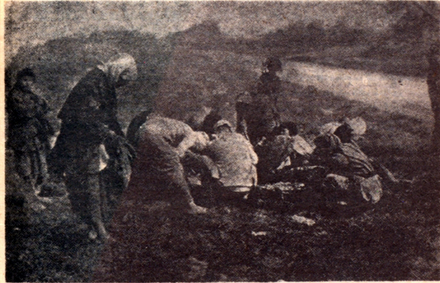
Հայ տեղահաններ՝ ձիու մը դիակին շուրջ

Համաժողովը իր օրակարգը պատրաստած եւ անոնց