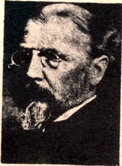
Գերման ծանօթ հայաէր՝ ՎԵՐ՝ ԵՈՒՀԱՆՆԷՍ ԼԵՓՍԻՈՒՍ

Չուիցերիա չէզոք երկիր մը ըլլալուն, հոն ալ Փրանսերէն թերթ մը պիտի հրատարակուէր եւ ի հարկին քաղաքական կարելոր կեդրոններուն մասնաւոր պատուիրակութիւններ պիտի զրկուէր, եւ պիտի տեղեկացուէր, թէ օտար վիճակագրութիւններու համաձայն, հայերուն արուե-