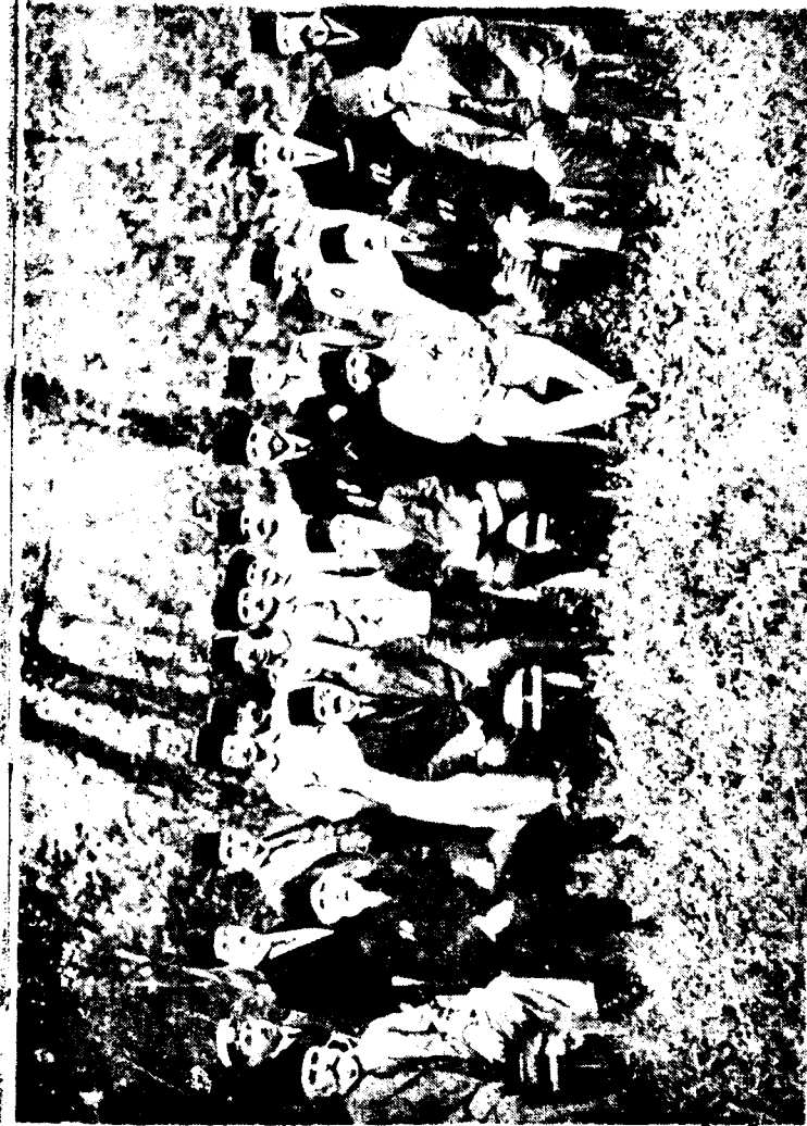
ԹԱՄԻՐ ԳԱՀԱՆՄԱՆՆԵՐԻ — 1) Թալաթ, 2) Էնվեր, 3) Մուսթաֆա Բէմալ, 4) Զեյնալ, 5) Տեքե, 6) Անվար Էնվեր, 7) Հիւսէյն Ժաֆար, 8) Մեհմետ Կոյսեբական փեթա, 9) Իսմայիլ Հաֆեզ, 10) Հիւսէյն Հեյրի, 11) Թահմէտ, 12) անձնածոթ, 13) Միթհատ Երզրէ, Իթթիհատի քարտուղար, 14) Մալանտաին՝ կոյսեբական փեթայ: Բացակայ են Պէհմետին Եսքէր, Տեքե, Նազմ եւ ուրիշներ:

— Ինչո՞ւ, որովհետև նախկինները Իթթիհատական, իսկ վերջինները ընդդիմադրութեան կը պատկանէին: