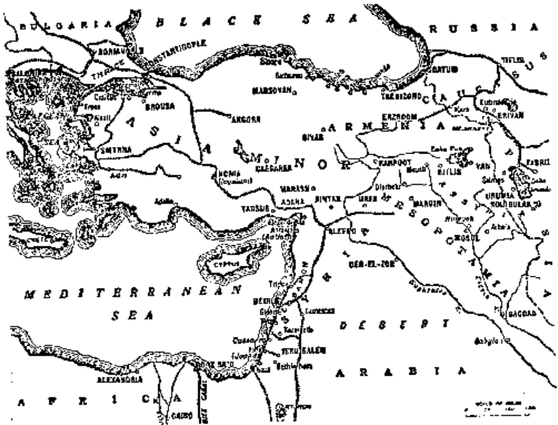
Օսմանյան կայսրության քարտեզը 20-րդ դարի սկզբին

Թուրքիայում երիտթուրքական հեղափոխությունից հետո հռչակված «ազատություն», «հավասարություն», «սահմանադրություն» գաղափարները փոխարինվեցին «պանթուրանիզմով»: 10