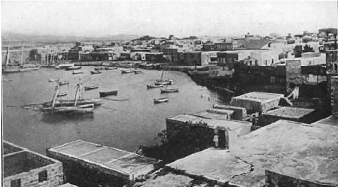
Ձկնորսական բնակավայր Վանա լճի ափին: Այս գավառում ավելի քան 55.000 հայեր են կոտորվում

1890-ական թթ. թուրքական պետությունը ստանում էր կայսերական Գերմանիայի աջակցությունը: Ահա 1898թ. Կայսր Վիլհելմ Երկրորդը ժամանելով Կոստանդնուպոլիս խրախուսում է համիդյան ջարդարար քաղաքականությունը: Առաջին համաշխարհային պատերազմը հնարավորություն ընձեռեց «Թուրքիան դարձնել թուրքերինը» 15 :