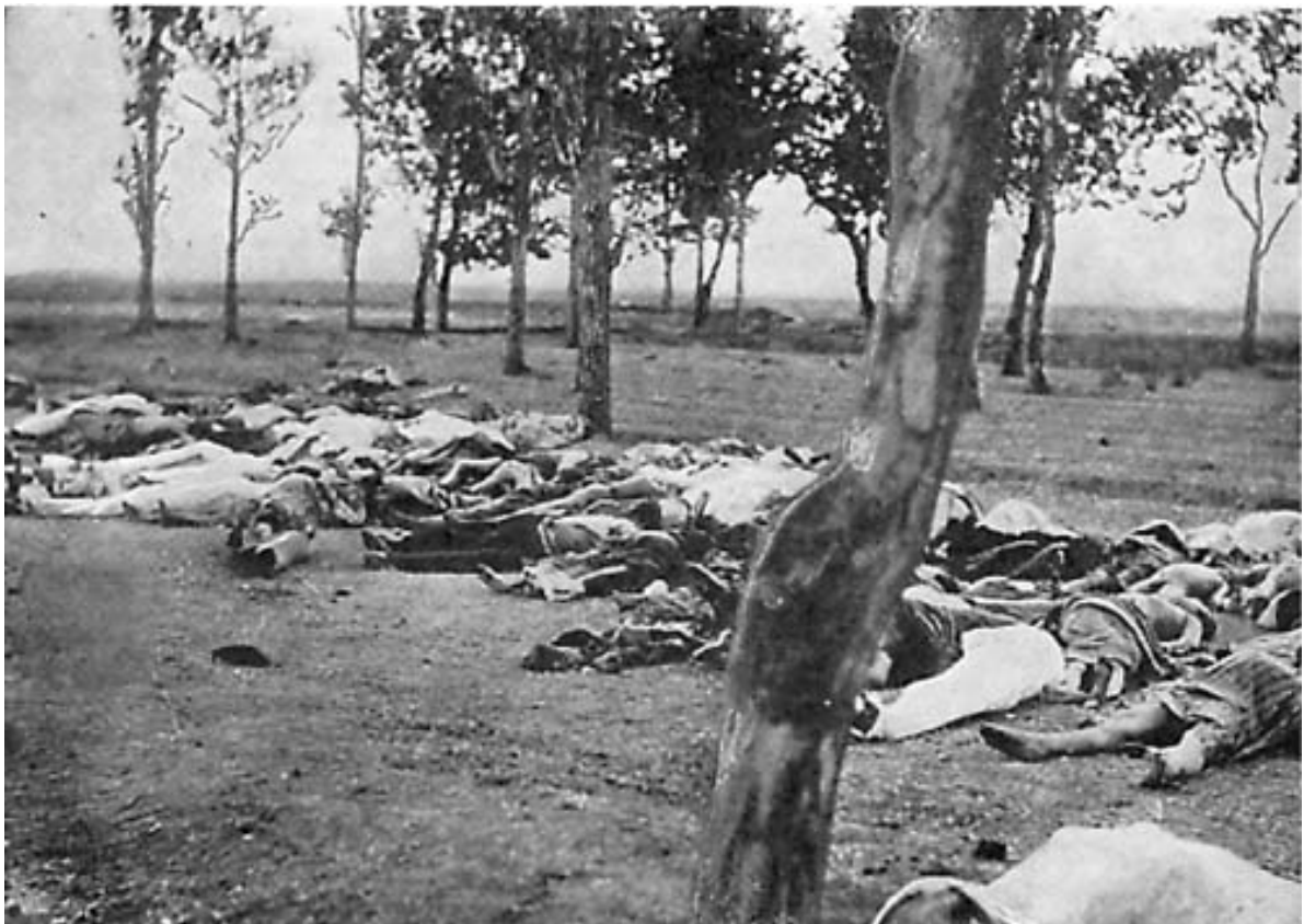
Գաղթի ճանապարհին նախճիրի ենթարկված հայերի դիակներ

Դեսպան Մորգենթաուն հայերի եղեռնագործությունը ավելի ցնցող գույներով է նկարագրում հուլիսի 24-րդ գլխում: Մանրամասնելով քրիստոնյաների նկատմամբ Օսմանյան կառավարության քաղաքականությունը, նա նշում է, որ բանակ զորակոչված հայ երիտասարդները զինաթափ արվեցին և օգտագործվեցին որպես բանվորական աշխատուժ: 50-100-ական հոգանոց խմբերով նրանց դուրս էին բերում և ամայի վայրում սպանդի ենթարկում: Հայերի ջարդի հիշողությունները այնքան շատ են Մորգենթաուի մոտ, որ նույնիսկ հեղինակը հրաժարվում է դրանց մի մասը նկարագրելուց: Վանի կուսակալ Ջևդեթ Բեյի մասին գրում է, թե «նա Բաշկալեի պայտահարն է»՝ հայ զոհերի ոտքերին պայտեր գամելու համար: