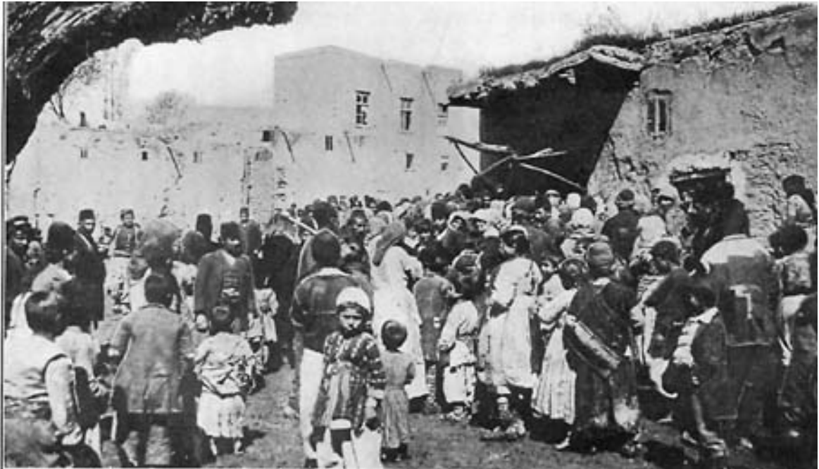
Գաղթականներ Վանի շրջանից, որոնք հույս ունեին ստանալ հաց, արտաքսվելով իրենց բնակավայրերից արտրվեցին անապատ: Հագարավոր երեխաներ, կանայք և տղամարդիկ սպանդի ենթարկվեցին:

Վանի հայկական գյուղերի բնակչությունը, Ահասարսուռ սպանդի ենթարկվեց: Գեղեցիկ հայ կանայք բաժանվեցին մահմեդականների միջև: Չորս օր անընդմեջ հայկական գյուղերը ջարդի և թալանի ասպարեզ էին: