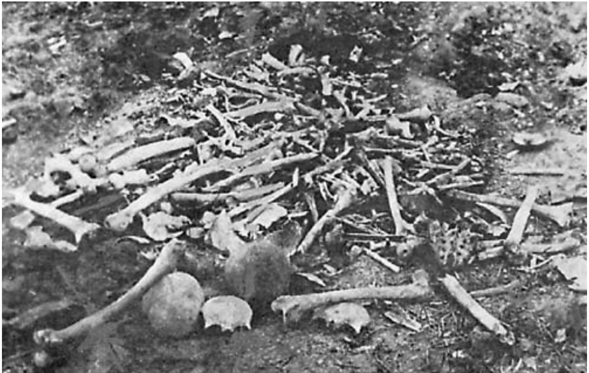
Սպանդի ենթարկված հայերի մասունքներ երզնկայում

Մորգենթաուն հիշատակում է, որ Օսմանյան կայսրության կառավարությունը հրապարակ հանեց իր մտադրությունը կայսրության տարբեր հատվածներում բնակվող 2.000.000-ից ավելի հայերին անապատային երկրամասեր «տեղափոխելու» համար: Հստակ արտացոլված և մեկնաբանված է այն հանգամանքը, որ հայերի նկատմամբ կառավարության մտադրությունը ոչ թե գաղթի իրականացումն էր, այլ ամբողջ ցեղի մահվան վճիռը 19 : Բազմաթիվ էջեր մանրամասնորեն ներկայացնում են հայերի աքսորն ու տեղահանության սարսափազդու տեսարանները «Գյուղ գյուղի ետևից և քաղաք քաղաքի ետևից, դատարկվեց իր հայ բնակչությունից, արդեն մանրամասնորեն նկարագրված տխուր պայմանների մեջ: Ստուգված տվյալների համաձայն, այս վեց ամսվա ընթացքում 1,200,000 ժողովուրդ դեպի սիրիական անապատը գաղթի ճանապարհ ելավ» 20 :