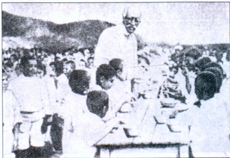
Ֆ. Նանսենը Լենինականի որբանոցում