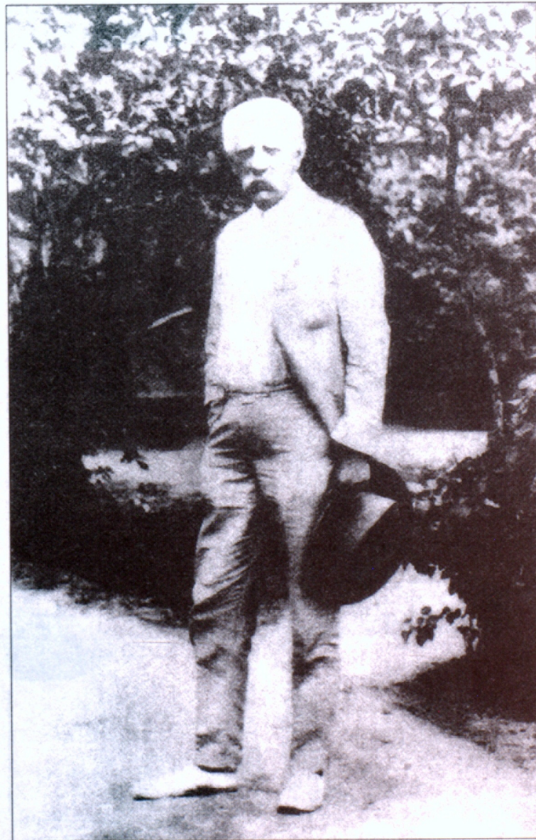
Երևանի պետական համալսարանի պատվավոր դոկտոր Ֆ. Նանսենը՝ համալսարանի գյուղատնտեսական այգում, 1925 թ.