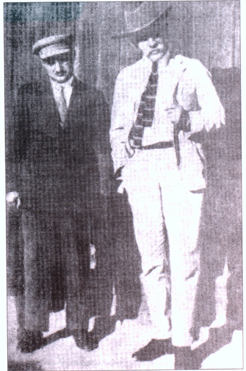
Ֆ. Նանսենը և Ա. Մռավյանը