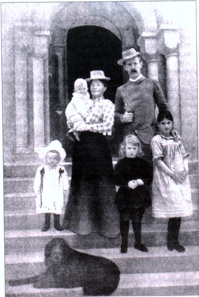
Ֆրիտյոֆ Նանսենի ընտանիքը